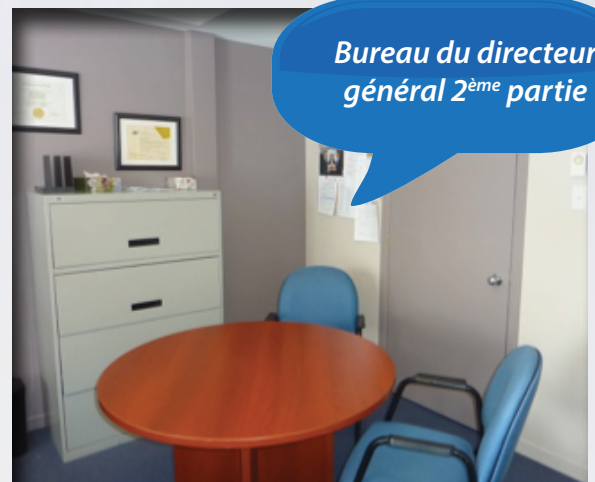
Bureau du directeur général 2 ème partie