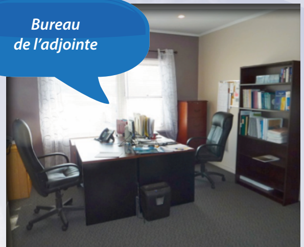
Bureau de l'adjointe