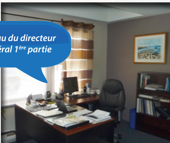
Bureau du directeur général 1 ère partie