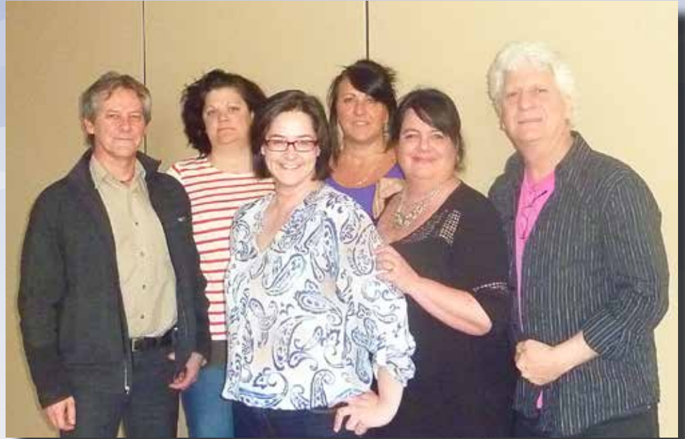
Huit rencontres régulières du C.A. ont eu lieu pour l'année 2013-2014.